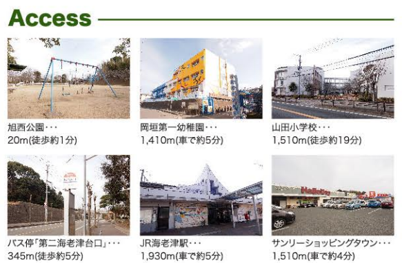
※徒歩分は1分=80mで計算しています。車による所要時間は時速40kmで計算していますが道路状況により多少異なる場合があります。