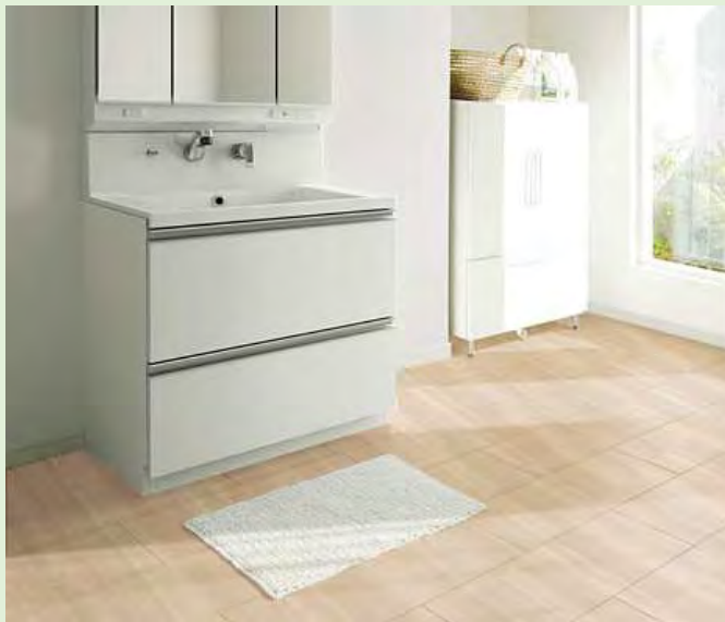
大理石。シャープでクリアな模様を活かし、木質系建材にも相性のいいブラウンをアレンジしました。