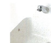
ハイバックガード カビやヌメリの原因となる汚れもたまりにくく、毎日のお手入れを簡単にします。