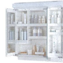
さまざまな工夫で充実の収納機能。