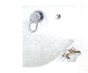
仮置きスペース 小物などを濡らさずに置けます。