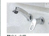
壁出し水栓 水栓の根元は、水も汚れもたまりにくく、衛生的で清掃もラクラクです。