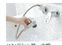
ハンドシャワー水栓 ホースを引き出せば、ハンドシャワーになり、シャンプーンやお掃除にも大活躍。ムダにお湯を使わない節湯水栓。